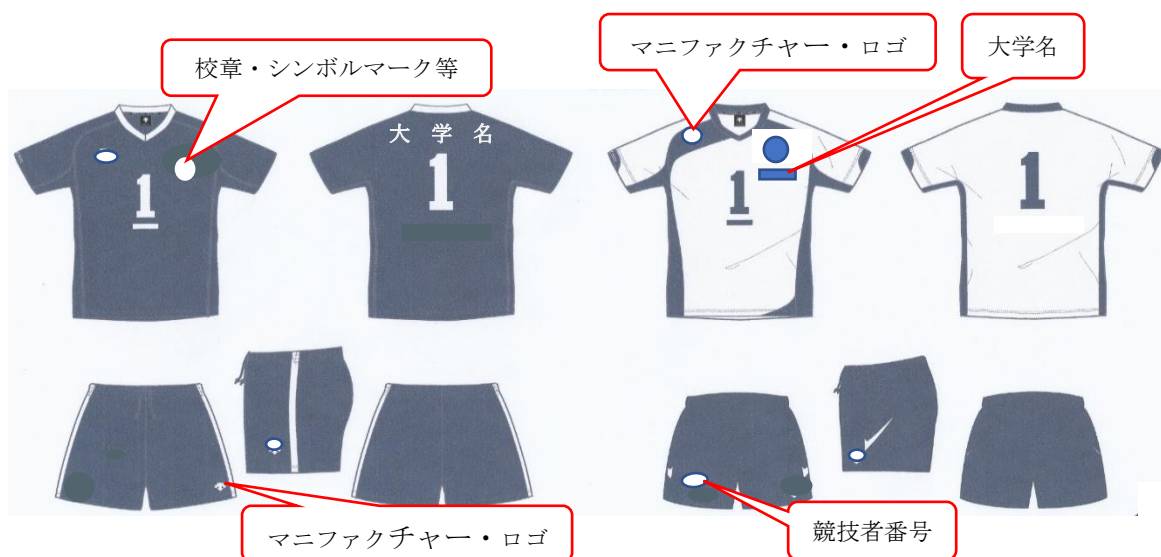
ユニフォーム等の広告規程(案)