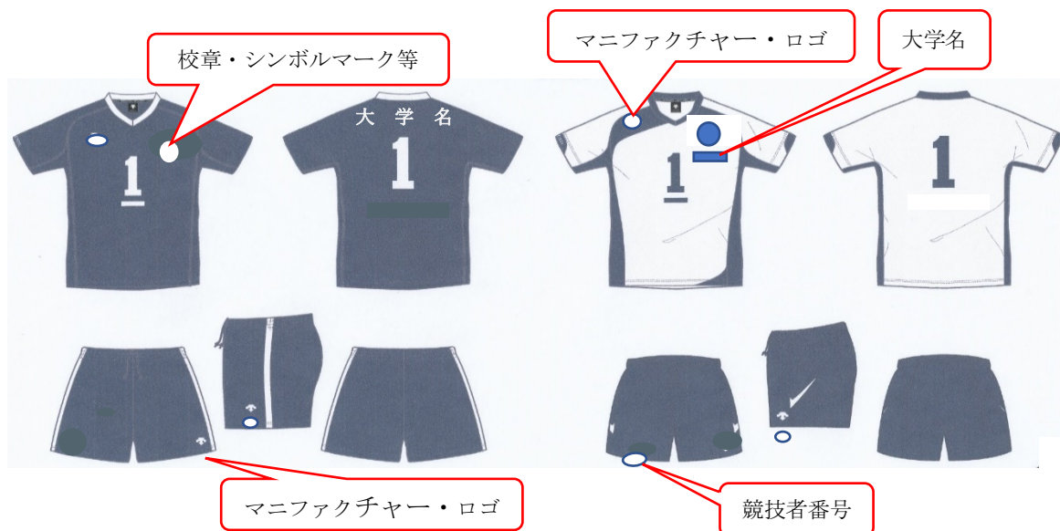
ユニフォーム等の広告規程(案)